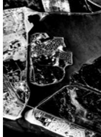
1974 passe occasionnelle