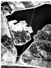
1968 situation d'origine