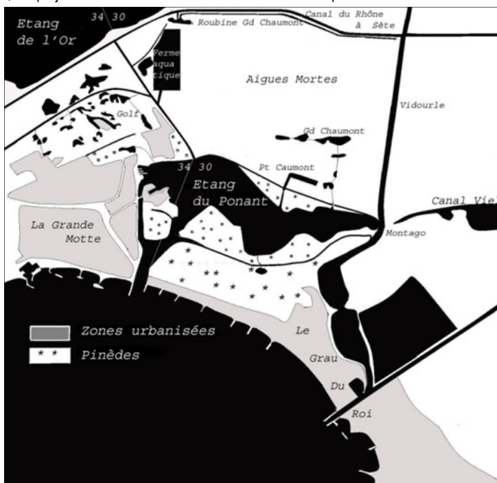
Le bassin versant du Ponant et son littoral mobilisent l'attention de l'ARP